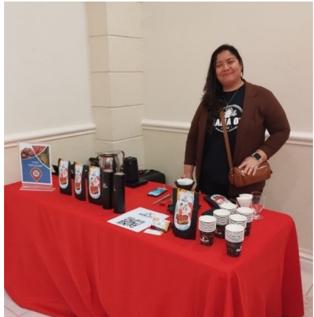
Fotografías varias del evento Panama Exotic Flavors, donde se presentó el catálogo de la oferta exportable para Barbados. Algunas de las empresas que asistieron como Joshebec Designs y Café Mama Otti.