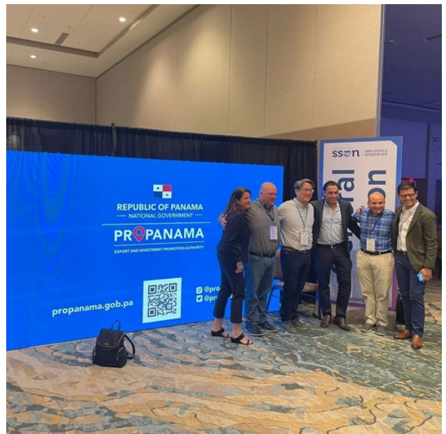
Desarrollo Shared Services & Outsourcing Week (SSOW) - Orlando, Florida.