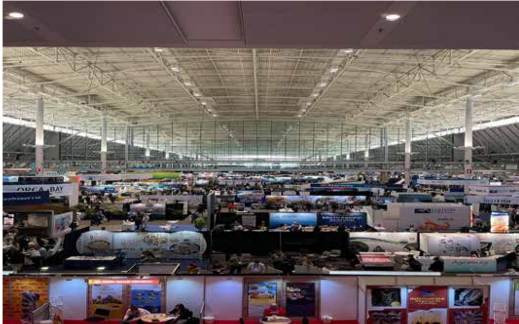
Vista área de los pabellones y participantes de distintos países, reunidos en SeaFood Expo North America.