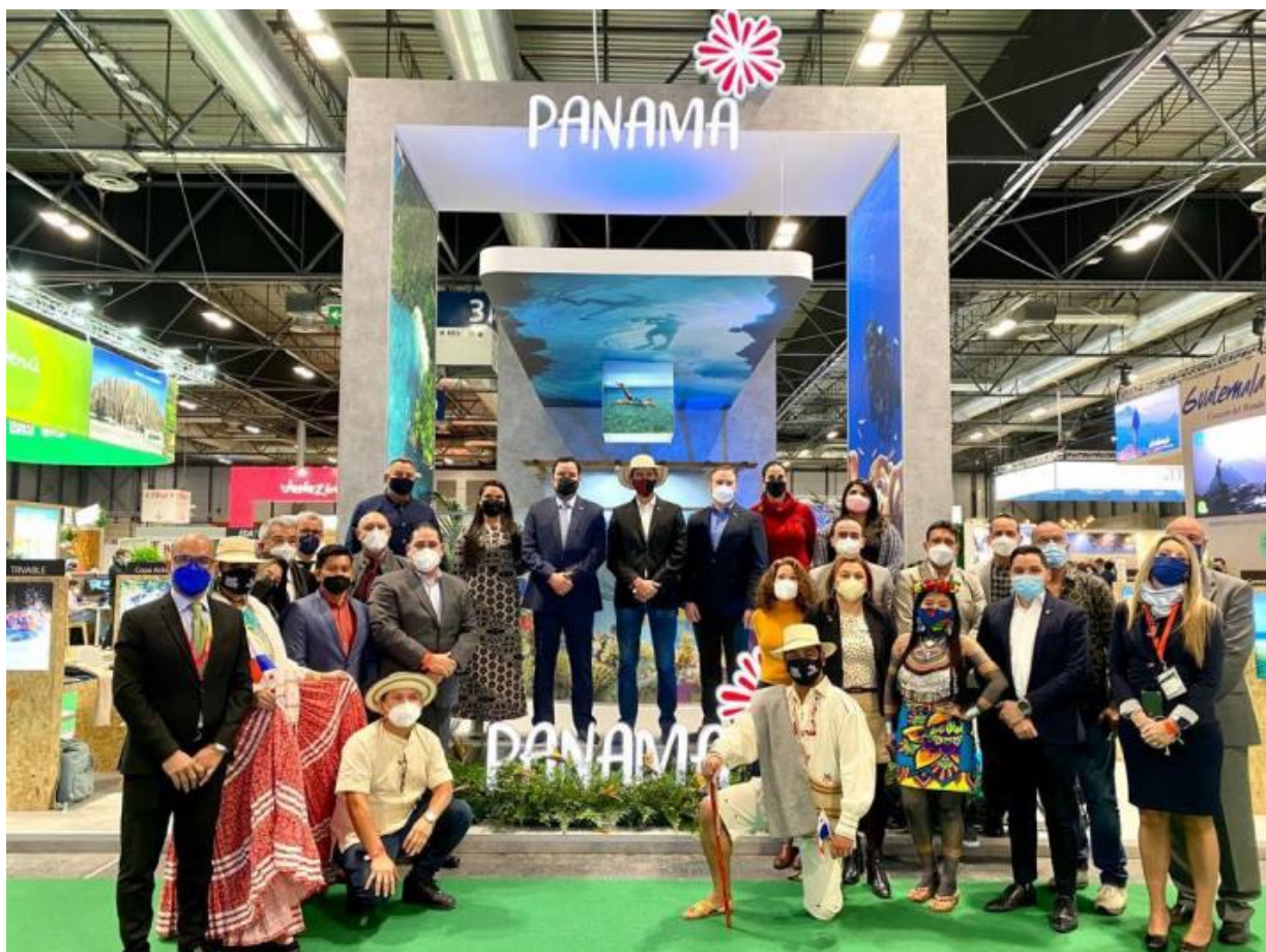
Imágenes durante el desarrollo de las diferentes actividades de la Feria Internacional de Turismo - FITUR 2022 – Madrid, España.