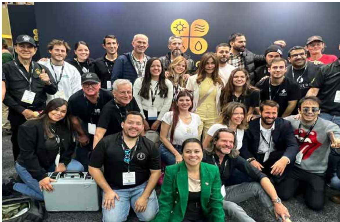
Delegación Panameña de productores y vendedores de Café de Especialidad