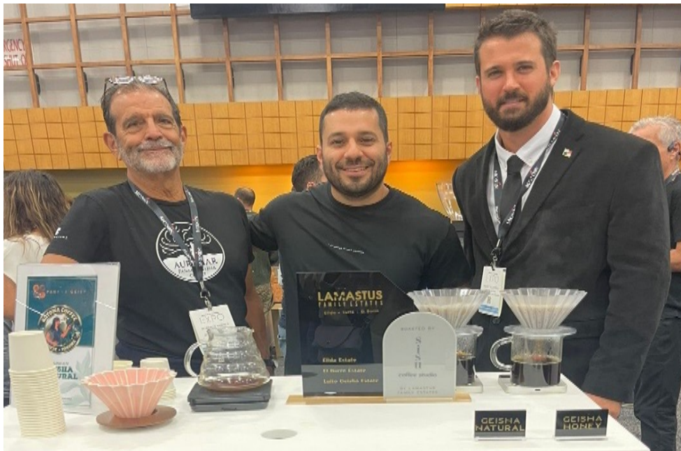
Se degustó café de todos los productores panameños participantes.