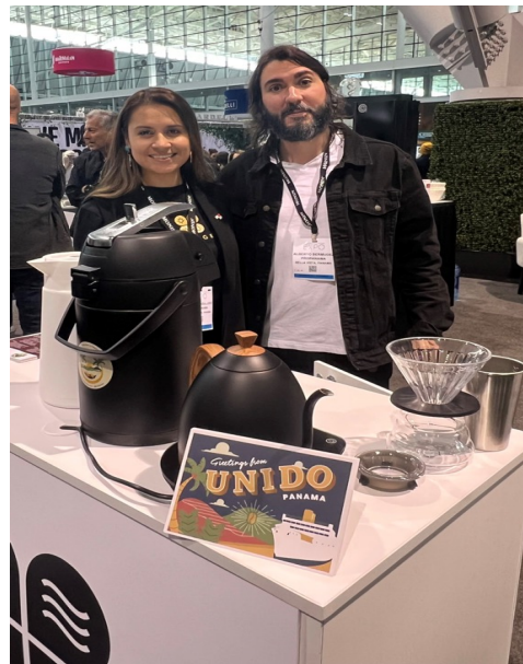
Degustación De Café Suárez Y Café Unido - PROPANAMA.