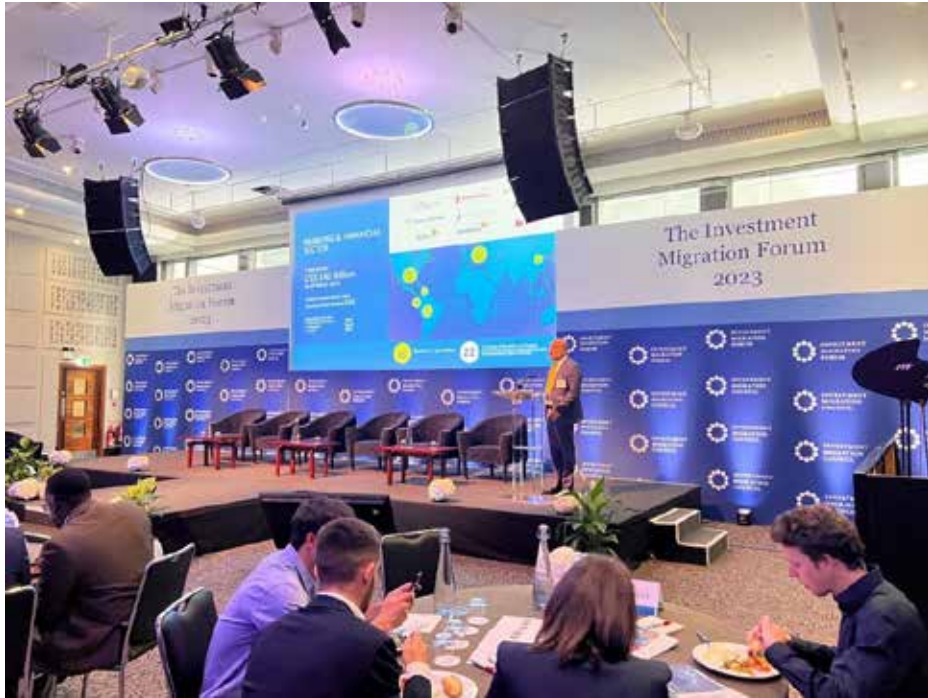
Presentación de Panamá en el Investment Migration Forum