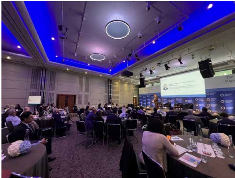
Presentación de Panamá en el Investment Migration Forum