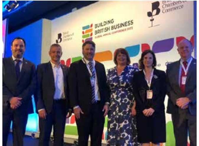
Participación en el Global Annual Conference 2023 por la British Chamber of Commerce