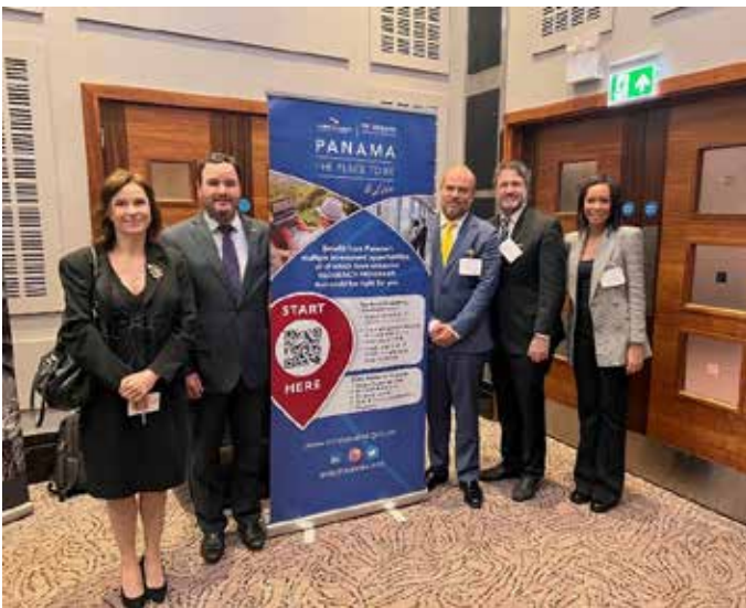
El stand de PROPANAMA en el IMF