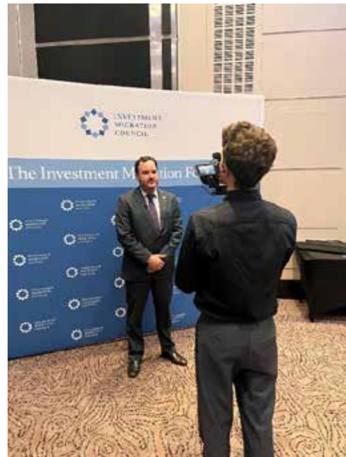
Entrevista en el IMF