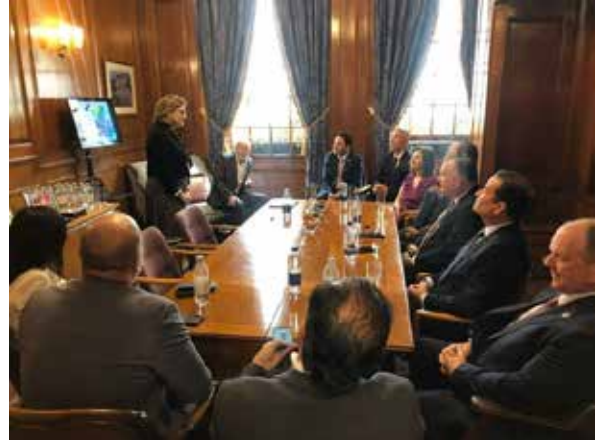
Reunión con Infrastructure & Projects Authority (IPA)