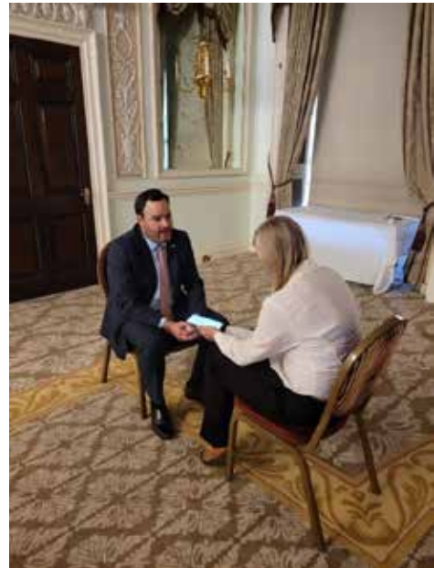
Entrevistas con Medio Locales