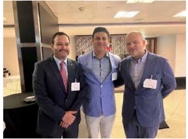
Recepción de Bienvenida en el Investment Migration Forum