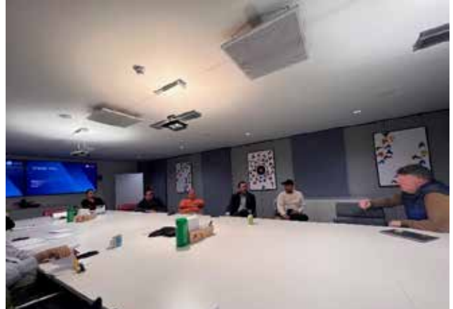
Visita al Centro de Innovación de Plexal