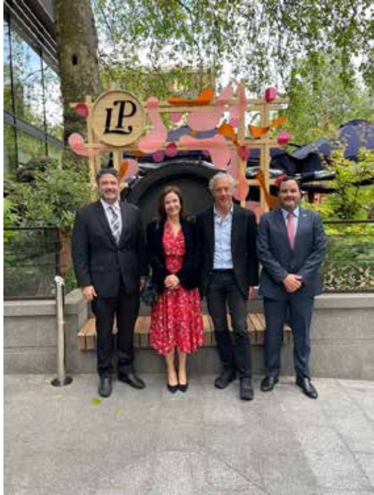
Reunión con Ian Livingstone