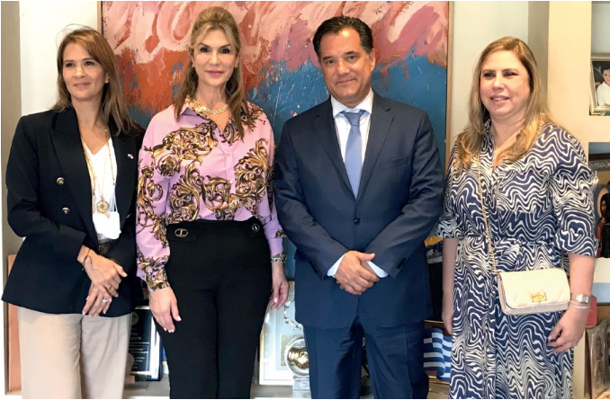
Delegación de PROPANAMA y la Embajadora de Panamá en Grecia sostiene reunión protocolar con el Ministro de Desarrollo e Inversiones de Grecia, Adonis Georgiadis.