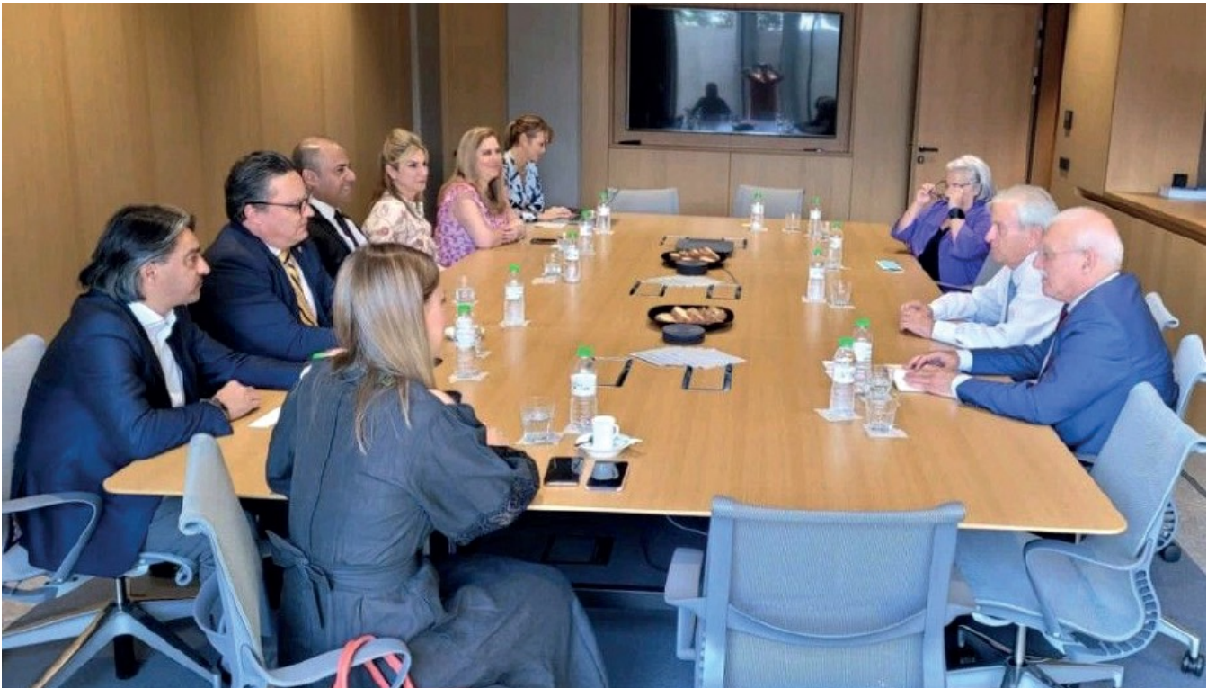
Reunión con el director general de Golden Union Shipping Co. SA, donde se discutieron oportunidades para la expansión de inversión en la industria marítima en Panamá.