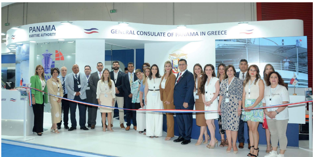
Personal de PROPANAMA y la Embajada y Consulado de Panamá en Grecia en el Pabellón de la República de Panamá en POSIDONIA 2022.