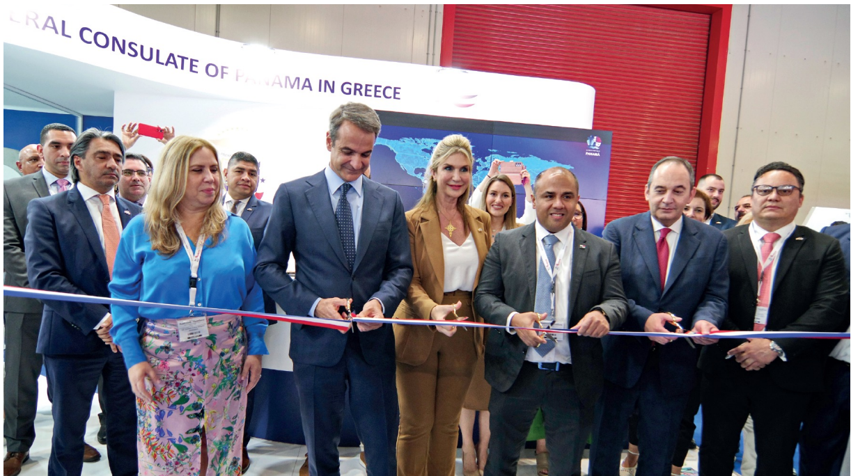
El Primer Ministro Kyriakos Mitsotakis corta la cinta inaugural del pabellón de la República de Panamá en Posidonia 2022.