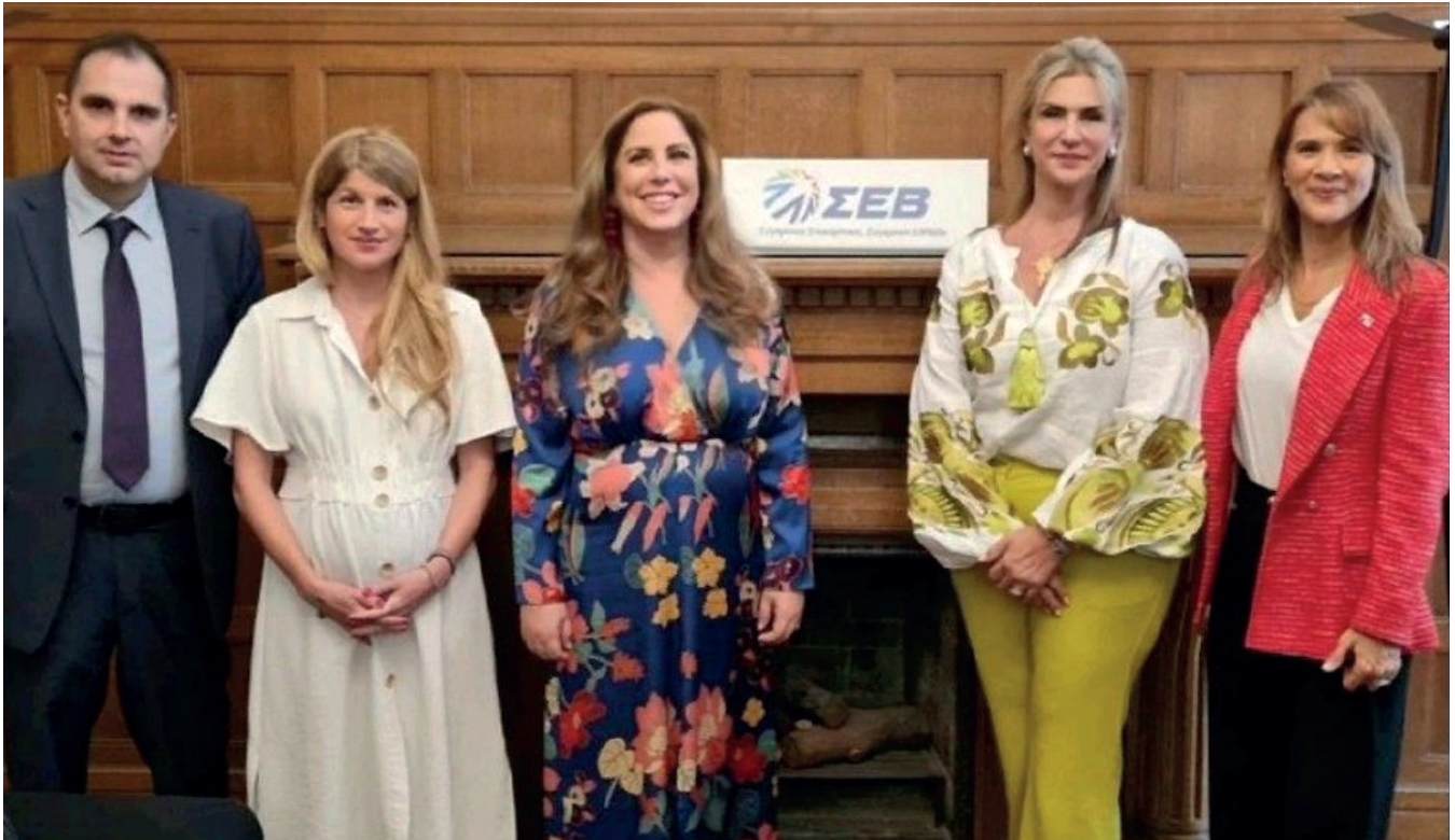
Encuentro con los miembros de la Federación Empresarial Helénica (SEV), para la coordinación de una misión comercial a Panamá de empresas griegas en 2023.