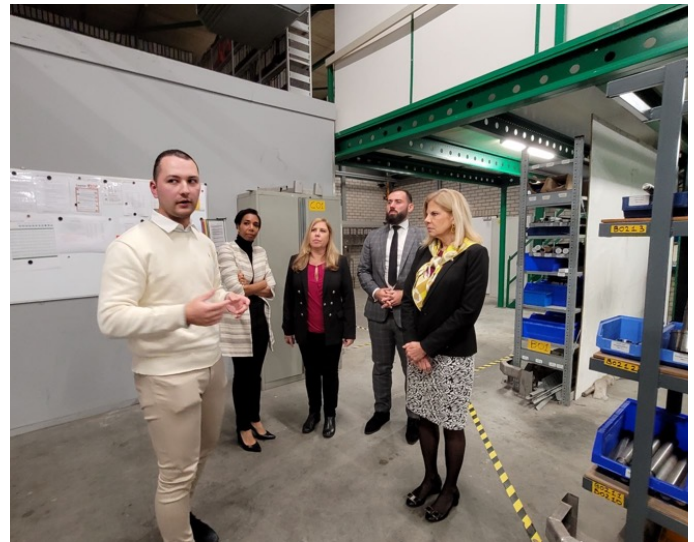
Visita guiada a la empresa MARCELISSSEN