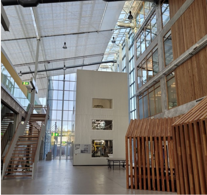
Instalaciones del centro LIOF