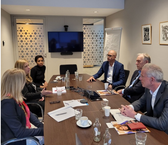
Reunión con directivos de NLinBusiness y Holland House Panamá, PROPANAMA y Embajada de Panamá en los Países Bajos.