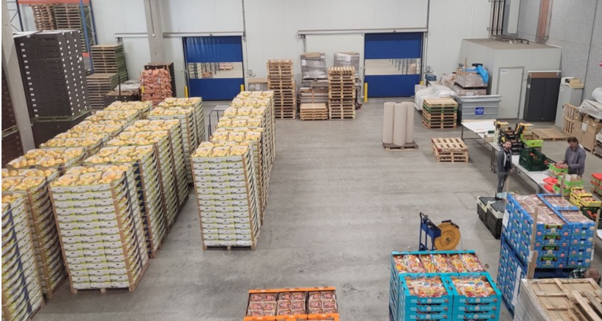
Visita a grupo SATORI importadores de frutas y especialistas en tubérculos, frutas y vegetales.