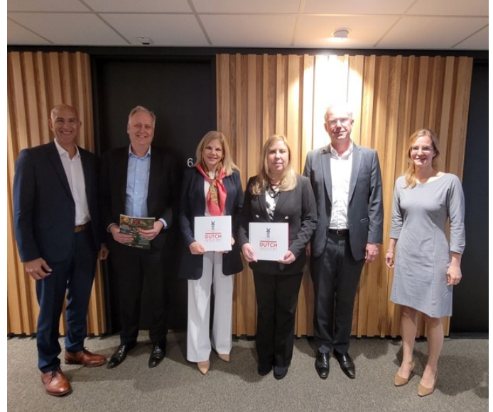
Foto grupal con directivos de NLinBusiness, Holland House Panamá, PROPANAMA y Embajada de Panamá en los Países Bajos.