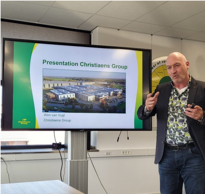
Presentación de la empresa Christiaens Group