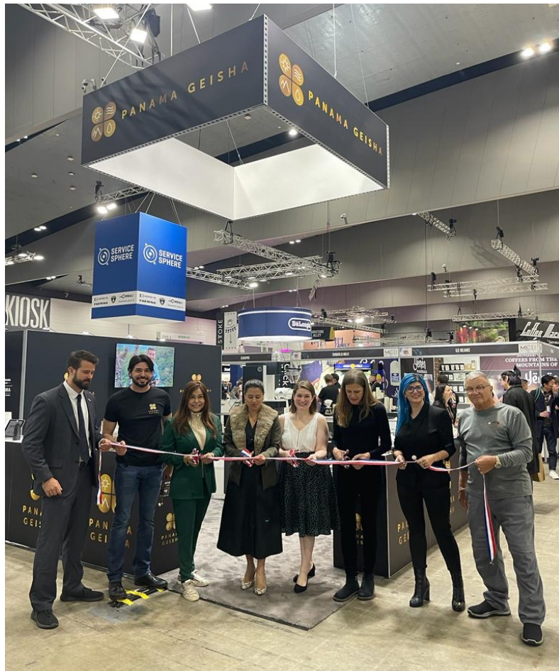
Corte de cinta para inaugurar stand de PROPANAMA con los organizadores de MICE y empresarios del Café