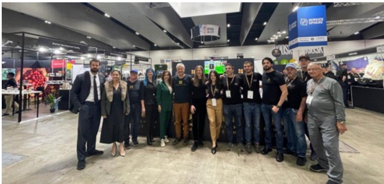
DELEGACION COMERCIAL CON PROPANAMA Delegación Panameña de productores y vendedores de Café de Especialidad