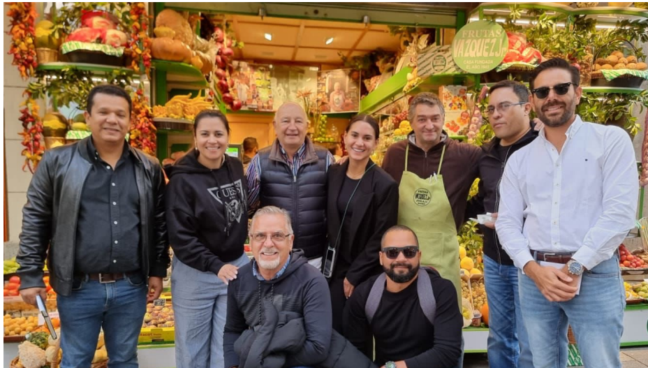
Delegación de empresarios panameños visitando Mini Markets.