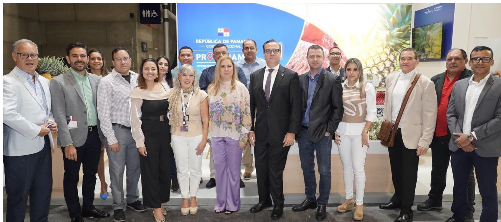
Delegación de empresarios, altos directivos de IFEMA, Administradora de PROPANAMA, Embajador de Panamá en España, Coordinadora de exportaciones.