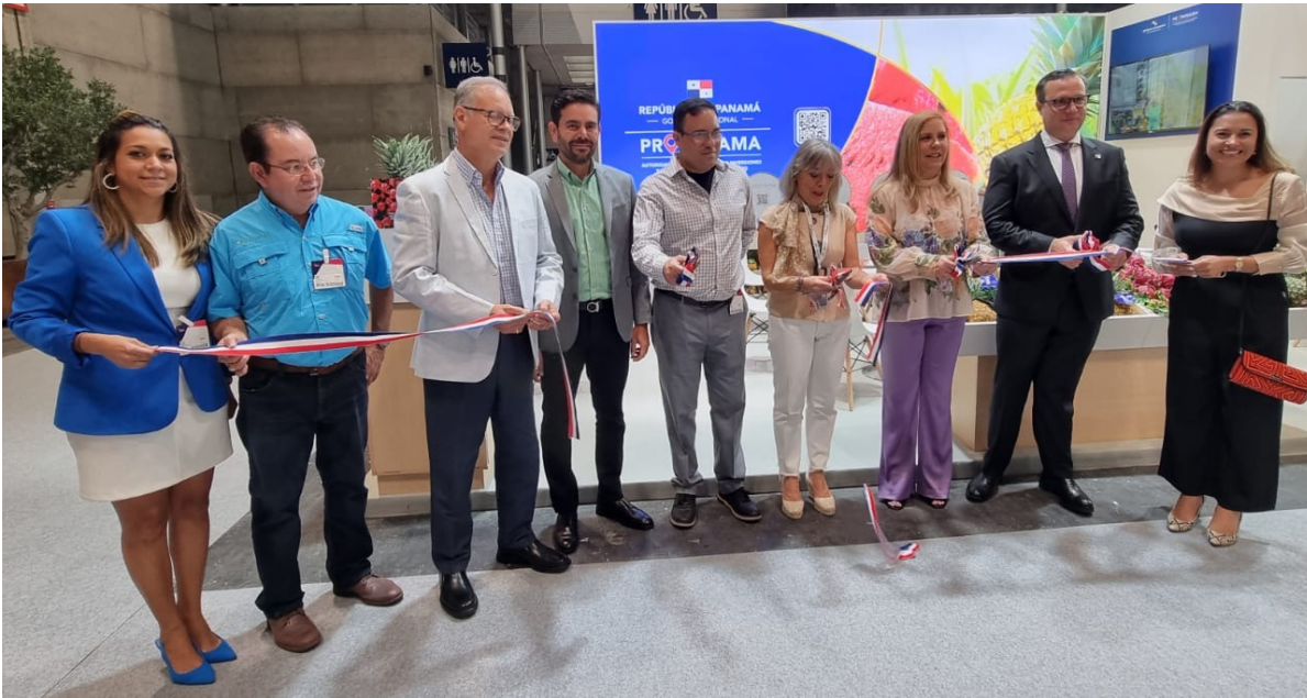
Corte de cinta del stand de Fruit Attraction por altos directivos de IFEMA, Embajador de Panamá en España, Administradora de PROPANAMA, Coordinadora de exportaciones, empresarios y otros.