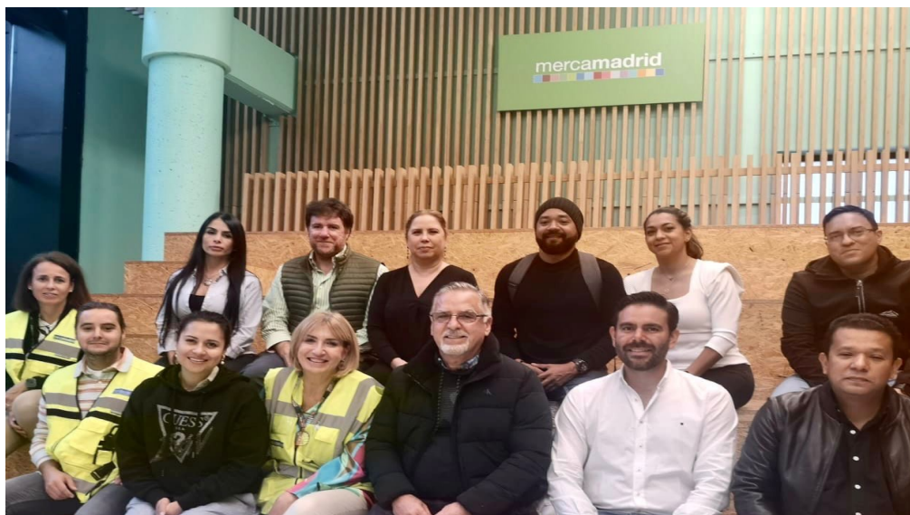
Visita a Merca Madrid, junto con los empresarios, Administradora de PROPANAMA, Coordinadora de Exportaciones y altos directivos de Merca Madrid.