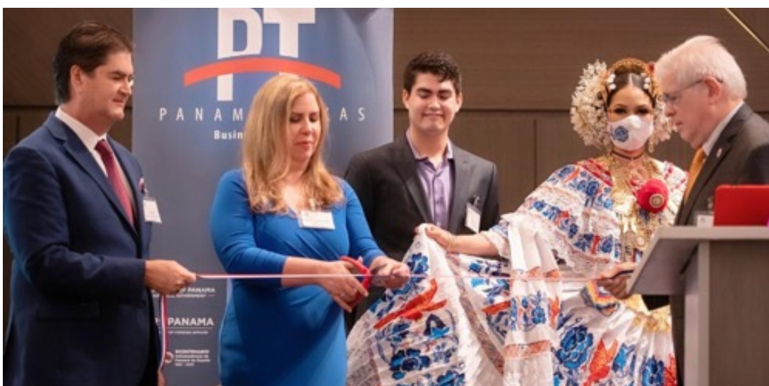
Inauguración y corte de cinta del Panamá -Texas Business Summit 2021