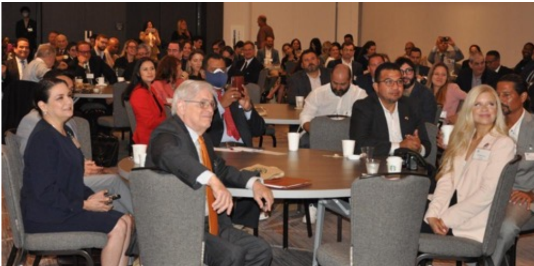
Invitados atendiendo las presentaciones pertinentes del PTBS