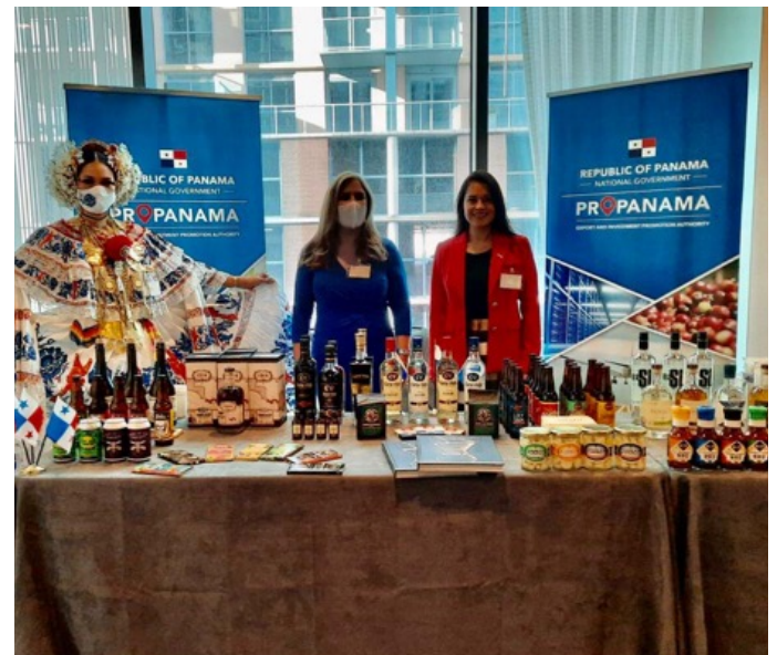
Oferta Exportable panameña exhibida en Panamá - Texas Business Summit