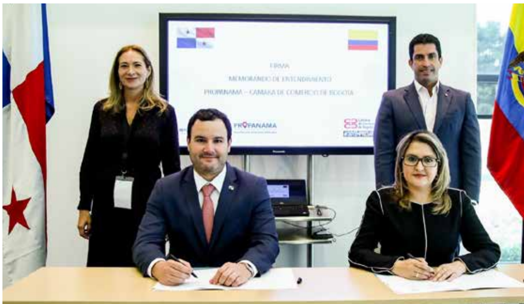
PROPANAMA y la Cámara de Comercio de Bogotá