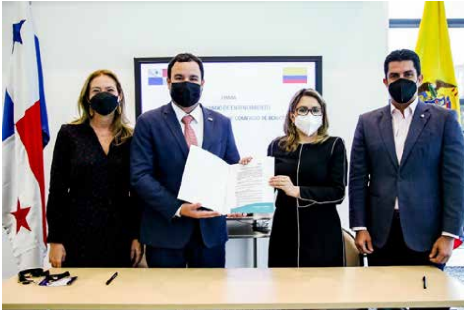
Firma de Acuerdo de Colaboración entre PROPANAMA y la Cámara de Comercio de Bogotá (CCB)