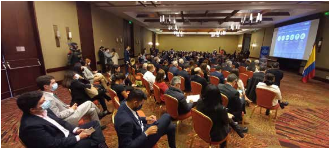
Presentación "Conectando a Panamá" en el hotel JW Marriott de Bogotá ante altos ejecutivos e inversionistas colombianos.