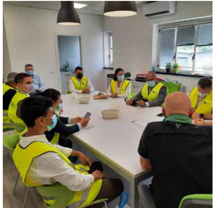
Reunión de Trabajo para intercambio de información B2B