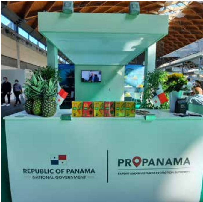
De cerca, stand de PROPANAMA con los productos ofertados para MACFRUT 2021, de las empresas inscritas.