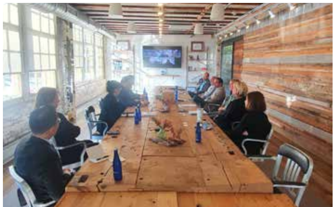
Se realizó una visita oficial a la empresa Urban Outfitters con su junta directiva - con el fin de atraer sus operaciones de manufactura a Panamá. Estuvo presente el equipo de PROPANAMA y del MICI, junto con el equipo del consulado de Panamá en Philadelphia.