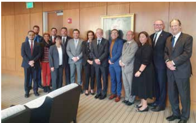
Con la Junta Directiva de DREXEL UNIVERSITY en donde se firmó un acuerdo de cooperación con PROPANAMA. Estuvo presente también el equipo de Ciudad del Saber y del MICI.