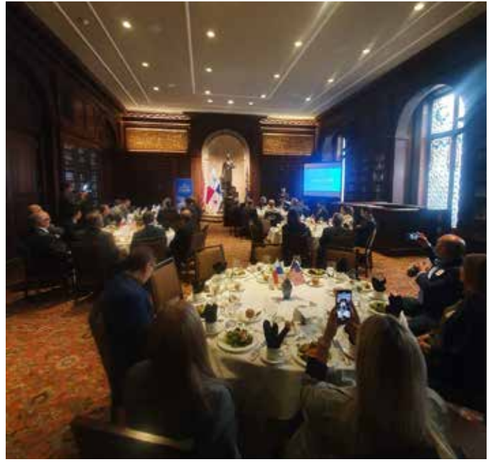
Exitoso evento "Connecting with Panama" con invitados especiales del World Trade Center de Filadelfia.